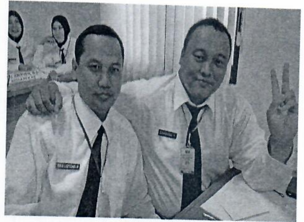
Gambar 12 : Melakukan kegiatan yang berhubungan dengan Pengembangan Potensi Diri