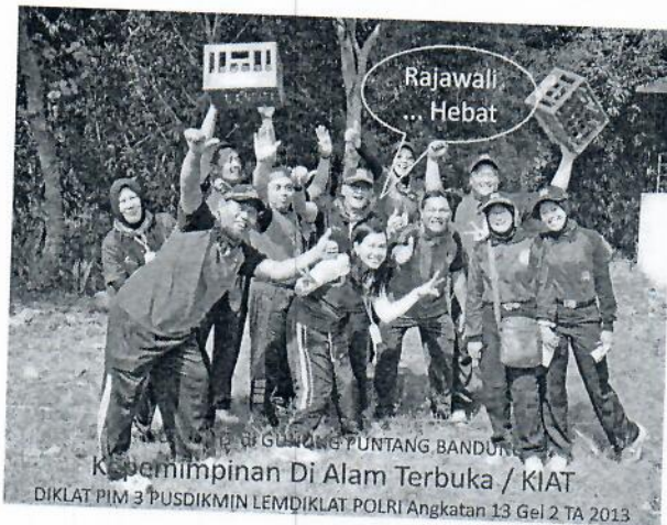
Gambar 7 : Peserta out bond melaksanakan game memindahkan krat