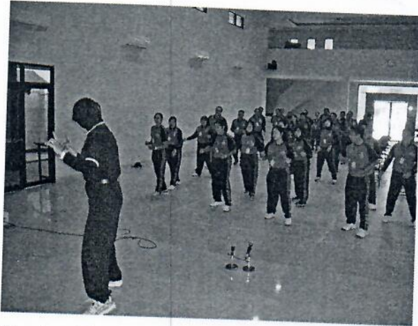
Gambar 17 : Peserta mengikuti kegiatan NAC