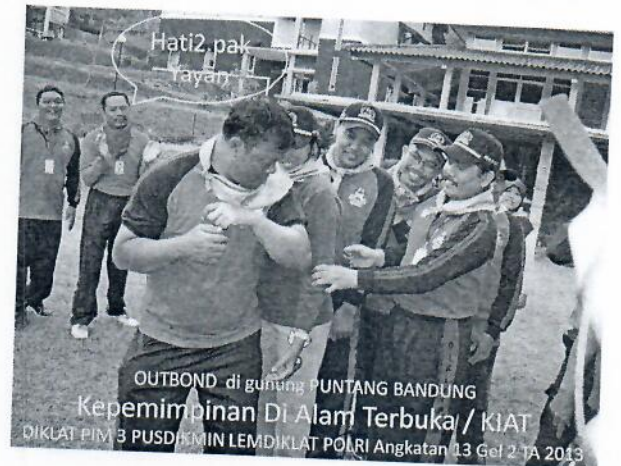
Gambar 6 : Peserta out bond melaksanakan game memindahkan tongkat estafet