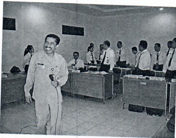
Gambar 19 : Peserta mengikuti proses pembelajaran