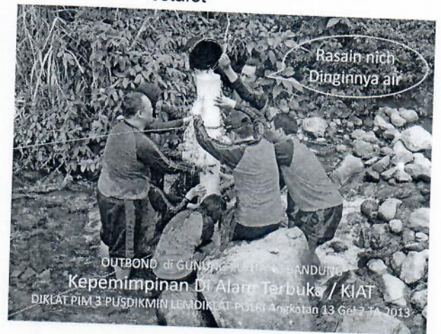
Gambar 8 : Peserta out bond melaksanakan game Paralon Bocor