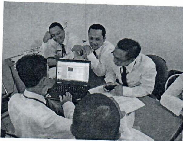
Gambar 21 : Peserta melaksanakan diskusi kelompok