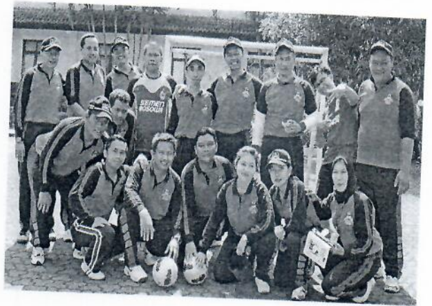
Gambar 24 : Peserta mengikuti olah raga bersama