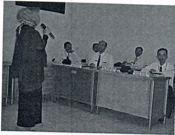
Gambar 11 : Penyampaian materi Pengembangan Potensi Diri