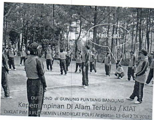
Gambar 3 : Peserta out bond melakukan pemanasan sebelum melaksanakan kegiatan