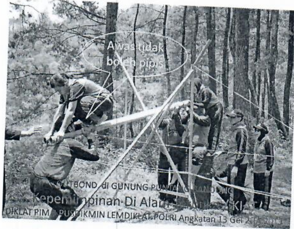
Gambar 5 : Peserta out bond melaksanakan game memindahkan drum