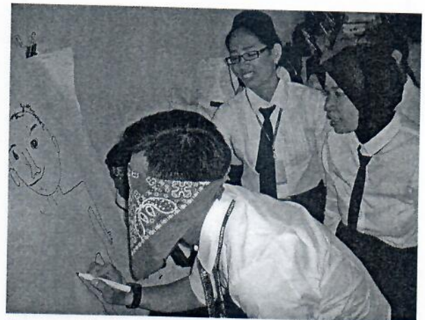
Gambar 14 : Melakukan kegiatan yang berhubungan dengan Pengembangan Potensi Diri