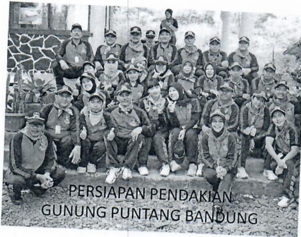
Gambar 1 : Peserta out bond berfoto bersama sebelum kegiatan dimulai