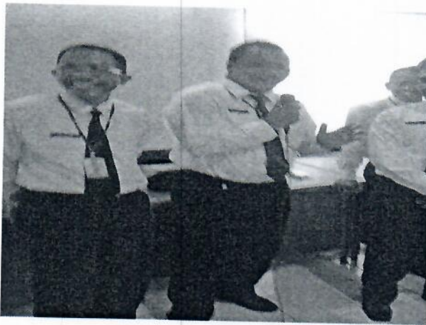
Gambar 13 : Melakukan kegiatan yang berhubungan dengan Pengembangan Potensi Diri