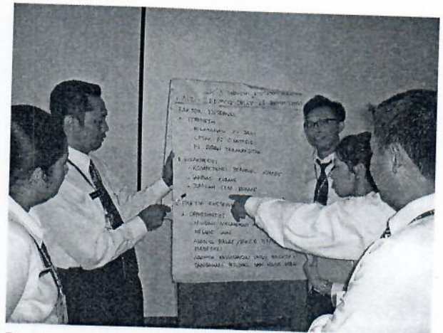
Gambar 20 : Peserta melaksanakan diskusi kelompok