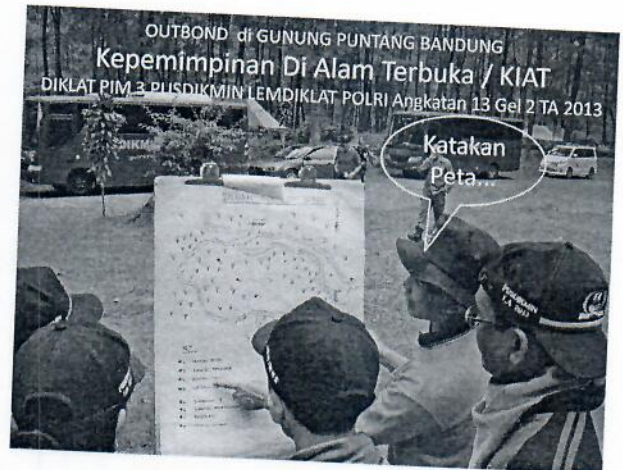
Gambar 2 : Panitia pelaksana memberikan arahan kepada Ketua masing-masing Kelompok out bond