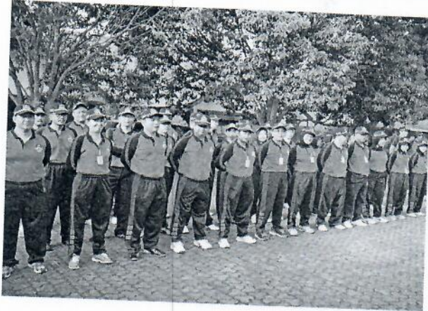
Gambar 23 : Peserta mengikuti apel olah raga