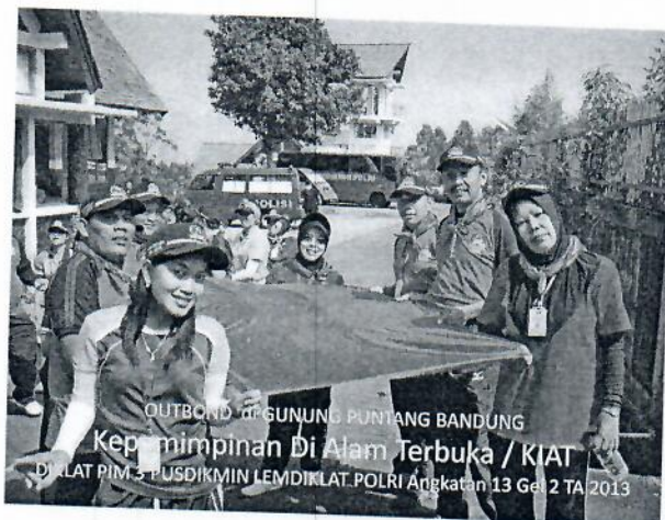
Gambar 9 : Peserta out bond melaksanakan game Krisis Air