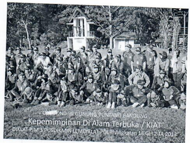
Gambar 10 : Foto bersama setelah penutupan kegiatan out bond