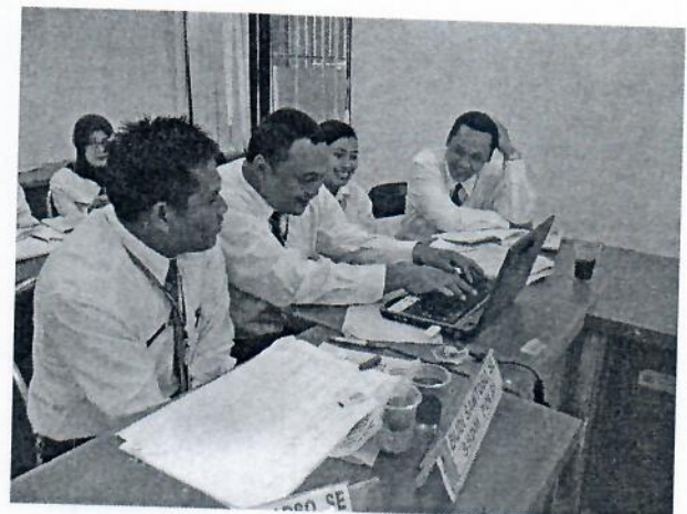
Gambar 22 : Peserta menyelesaikan penugasan-penugasan kelompok