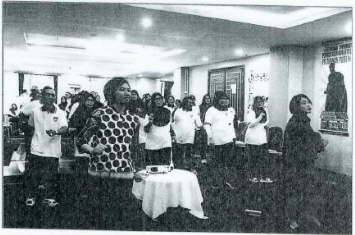
PELATIHAN OLEH TIM LEMDIKPOL