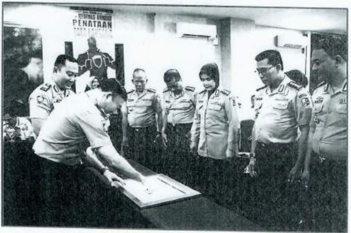
PENANDATANGANAN PAKTA INTEGRITAS