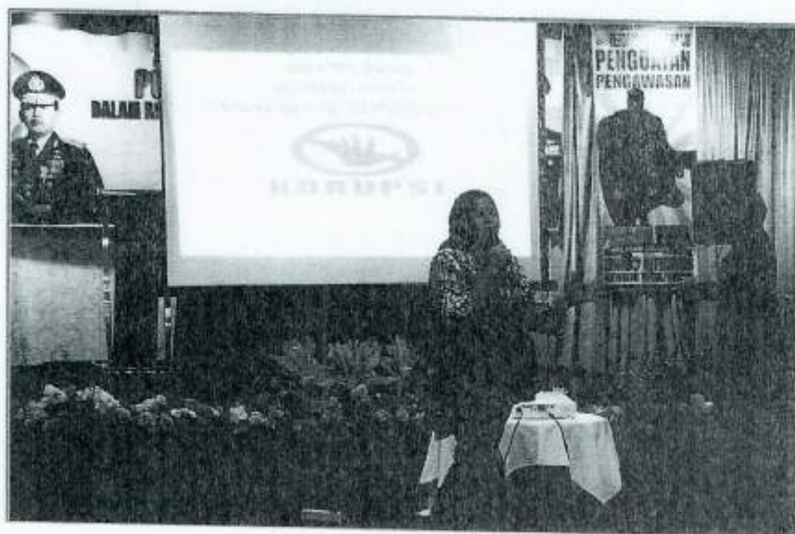
PELATIHAN OLEH TIM LEMDIKPOL