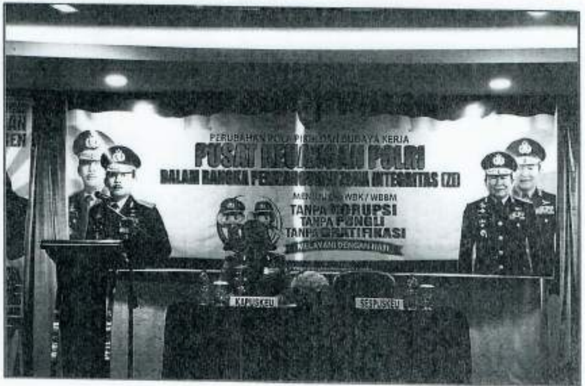
PEMBUKAAN OLEH KAPUSKEU POLRI