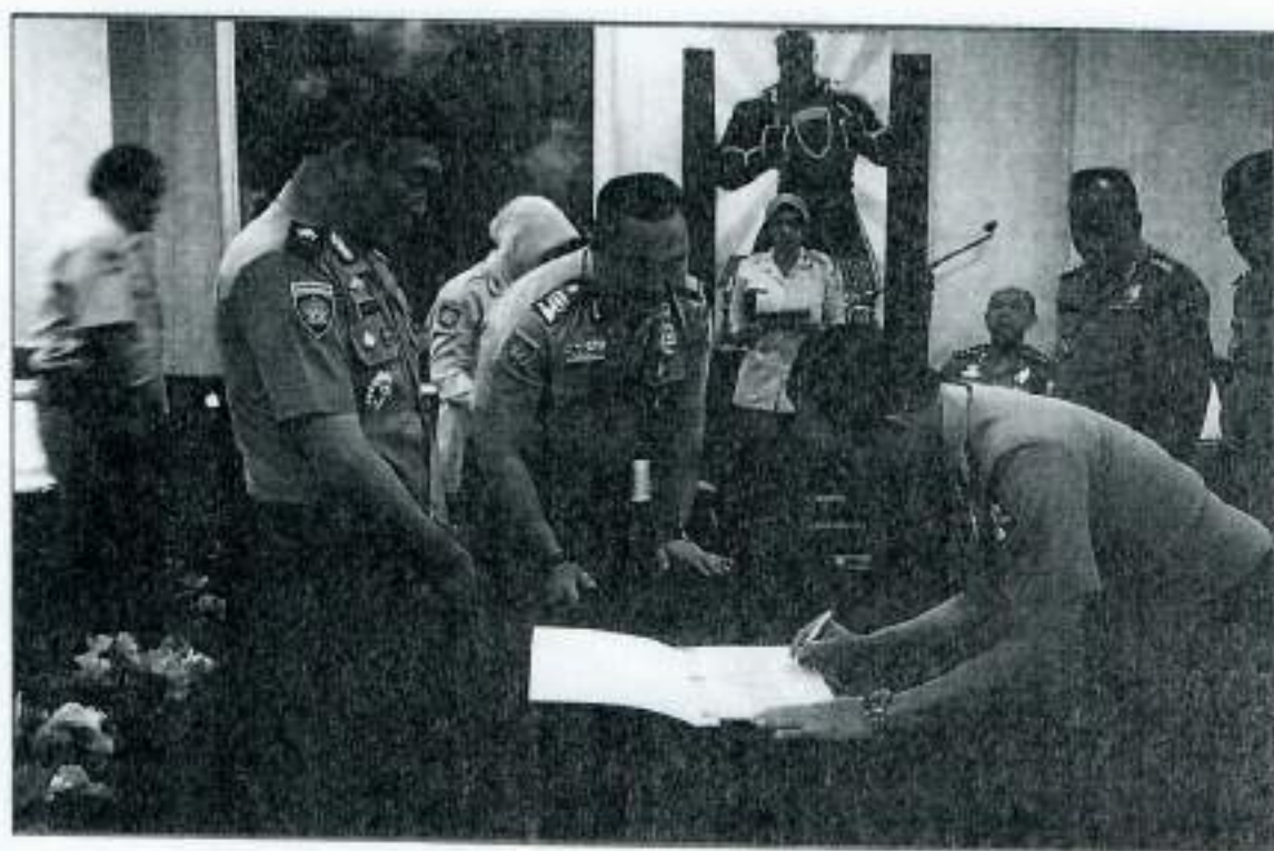
PENANDATANGANAN PAKTA INTEGRITAS