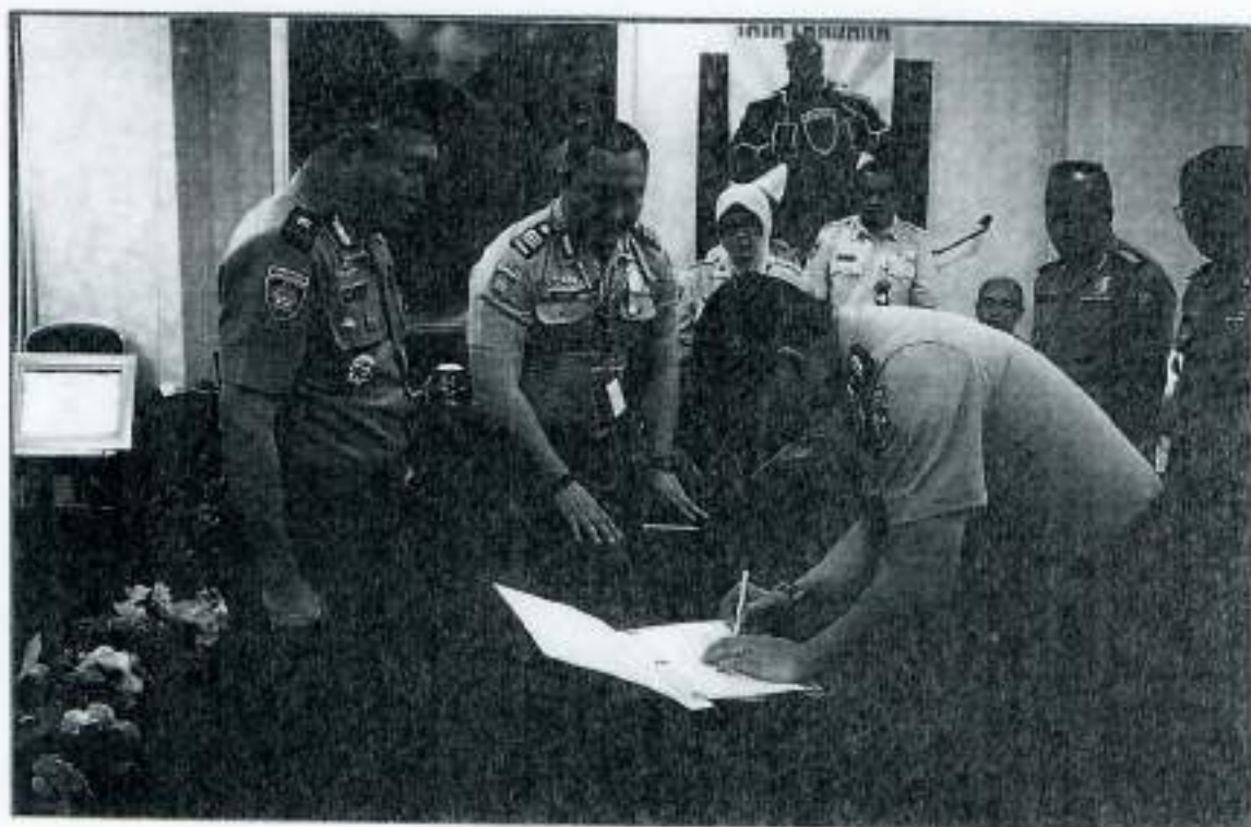
PENANDATANGANAN PAKTA INTEGRITAS