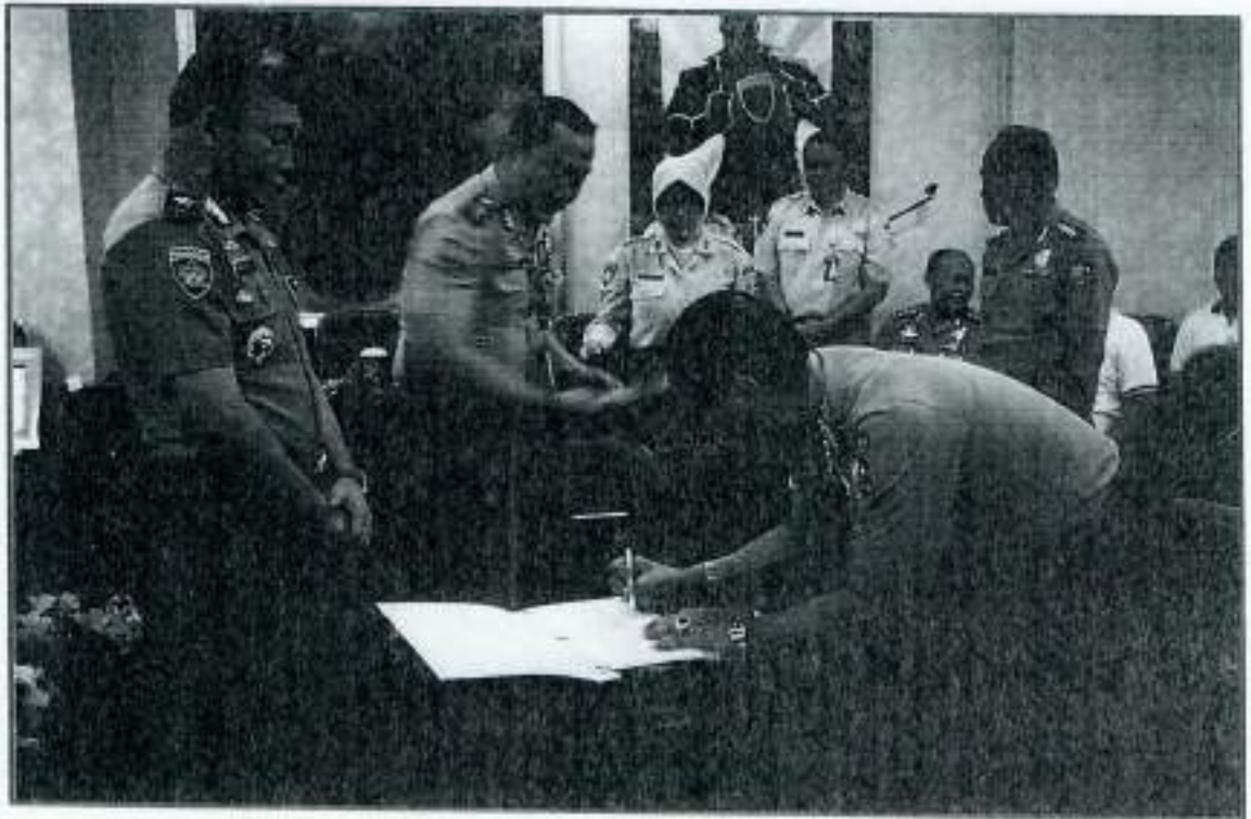
PENANDATANGANAN PAKTA INTEGRITAS