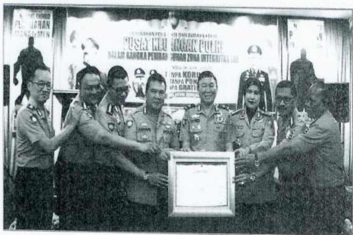
SOLIDARITAS PJU DAN STAF PUSKEU POLRI